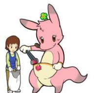
▲ボランティアPRキャラクター ラボちゃん