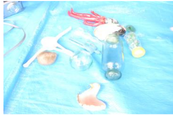
↑ 海洋ゴミ紹介 (入れ歯、海玉、シーグラス等)

国内や海外各地でビーチクリーン活動を自身で実践されて、そこで拾ったさまざまな漂着物を紹介。海洋ゴミが招く自然への影響などを紙芝居でわかりやすく説明されました。