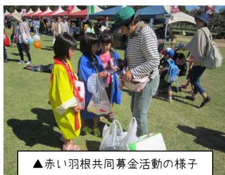
▲赤い羽根共同募金活動の様子