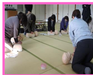
▲26年度 支援講座の様子 (心臓マッサージ)