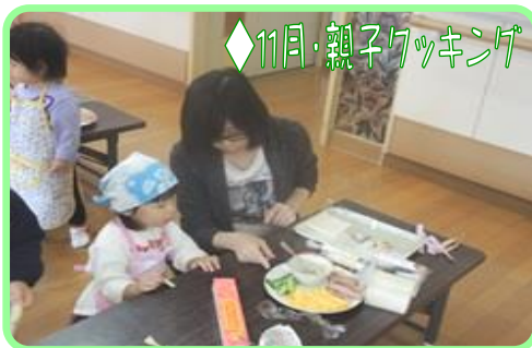
◆11月・親子クッキング

10月は、運動会を開催。年齢層に合わせたプログラム内容で、子どもたちも元気に参加していました。